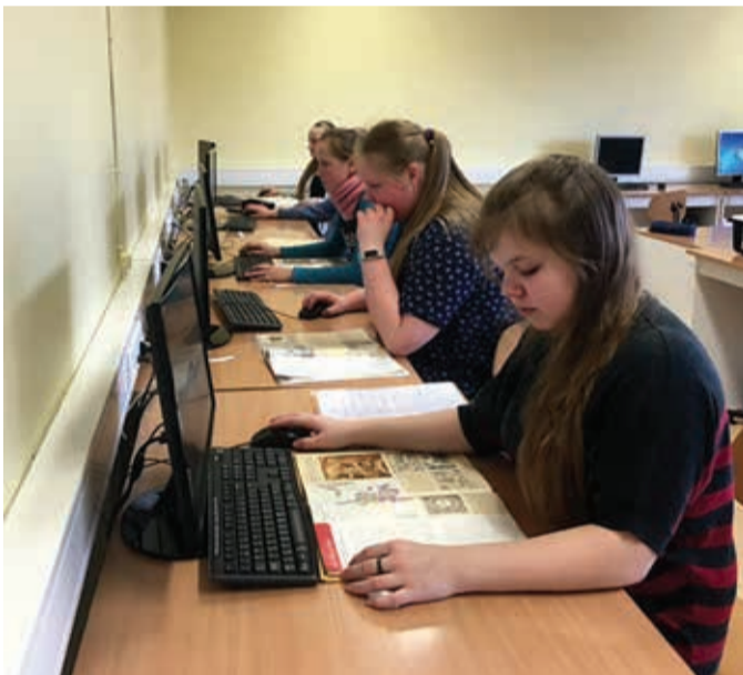
7. klass arvutiklassis.