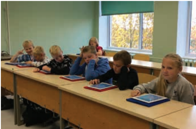
4. klassi tund iPadidega.

Meie kooli õpetajad on enda parimaid praktikaid iPadide kasutamises õppetöös jaganud ka kolleegidele. Igal aastal augustikuus korraldab Tallinna Gustav Adolfi gümnaasium IKT konverentsi, kus teine päev on pühendatud iPadidele. Kahel aastal on konverentsil õpituba korraldanud meie kooli direktor,