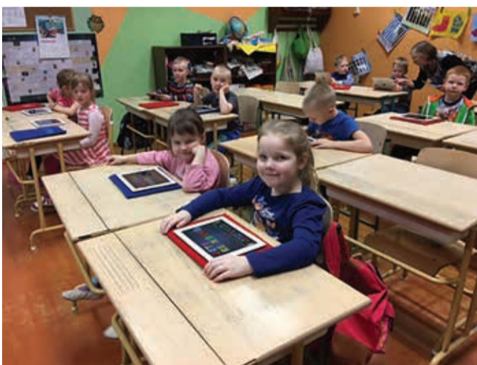
Eelkooli lapsed iPadidega tutvumas.

õppe- ja arendusjuht ning haridustehnoloog. Kutse selle aasta konverentsil esinemiseks on kooli juba saanud. Esinetud on Väätsa digikonverentsil, koolitust on läbi viidud Kiigemetsa koolis.