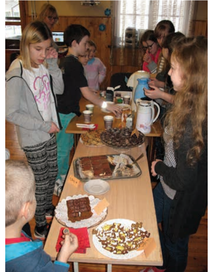
Õiglase kaubanduse kohvikus müüsid õpilased fairtrade-märgistusega toorainest valmistatud küpsiseid, kakaod, teed ja kohvi.

28. novembril ehk esmaspäeva hommikul tutvustati meile, mis on maailmanädal ja mida me sel nädalal tegema hakkame.