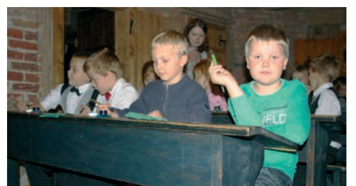
1. klassi lapsed Palamuse kihelkonnamuuseumis.