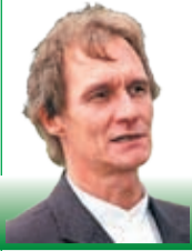
Aare Aunap vallavanem

Veebruar on eestlasele olnud eestluse ja omariikluse mõttes märkimist vääriv kuu. Oli ju veebruar just meie iseseisvuse deklareerimise ja iseseisva riigi tekkimise kuu ning just veebruaris jõudis lõpule selle noore riigi esimene tõsisem tuleproov, mis lõppes meile võiduga ja tipnes Tartu rahuleppes. Lisaks neile on kalendris kirjas mitmed eesti rahvakalendri tähtpäevad, millest ehk tuntuimad küünlapäev ja vastlapäev. Uue aja trende järgides on traditsiooniliseks muutunud ka sõbrapäev.