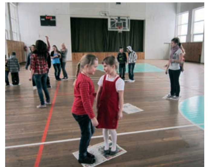
Sõbrapäeva Valentini ja Valentina valimiste võistlejad võistlushoos.

14. veebruaril tähistati koolis sõbrapäeva. Igal vahetunnil toimusid erinevad võistlused, päeva lõpuks selgus tublim tüdruk, keda autasustati krooniga – Valentina – ja vapraim poiss, keda autasustati uhke kaabuga – Valentin.