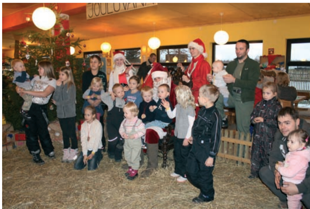
Vudila jõulumaa pakkus tegemiskui ka osalemisrõõmu nii suurtele kui ka väikestele.

„Kindlasti on igas erakonnas inimesi, kes ühes valdkonnas mõtlevad ühte moodi ja mõnes teises valdkonnas erinevalt, kuid sotsidesse koondunud inimestel, olenemata nende taustast, on kindlasti mure ühiskonna sidususe ja hoolivuse pärast. Usun, et sellist muret on parempoolset maailmavaadet esindavatel inimestel oluliselt vähem. Olles küll ise ka pigem ettevõtja, olen kindlasti seda meelt, et need, kellel on võimalik, tuleb ka ühiskonda rohkem panustada. Minu sotsiaalse närvi kohaselt ei saa elada Eesti niigi üliliberaalses maailmas hundiseaduste järgi – need, kes ise endaga hakkama ei saa, neid meil justnagu polekski vaja. Ausalt öeldes see, et näiteks maanimene toetab riigikogu valimistel tänasesse valitsuskoalitsiooni kuuluvaid erakondi, on mulle