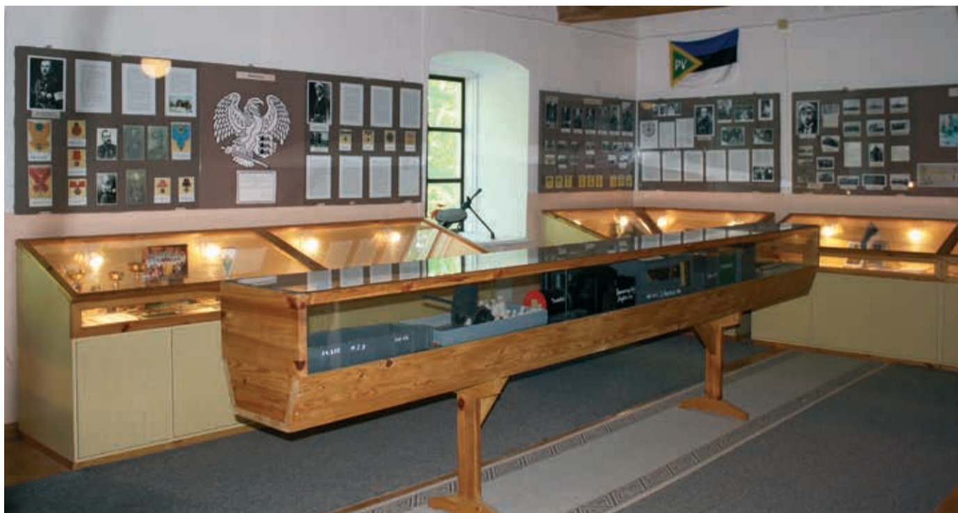
Püsiväljapanek kajastab põhjalikult ka Kaitseliidu tegevust.