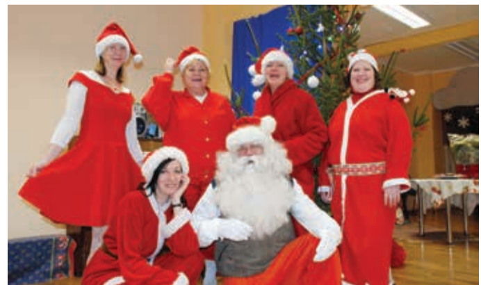
Jõuluvanal olid abiks kelmikad päkapikud.

Kuna lumega oli meie maal parasjagu kitsas käes, ei tekkinud lastel ka eriti küsimust, miks jõuluvana seekord saaniga ei tulnud. Et lapsed olid jagatud väikestesse gruppidesse, oli neil aega rahulikult jõuluvana suhelda, salmi lugeda ja fotograafidele poseerida.