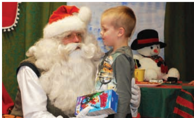
Kõik lapsed said jõuluvanal kingipaki.

tegukseda. Jõuluvana uhkes köögis kaunistas iga laps endale köögipäkapiku abiga oma piparkoogi. Kuigi glasuuri sai torbikust maitstud ohtrasti, piisas seda õnneks ka kaunistamiseks. Postkontoris sai veenduda, et iga lapse soovid on tõesti kirja pandud ja päkapikkudel aruanded esitatud. Postipäkapikk aitas kodukaunistuseks meisterdada uhke vitraazi. Tõelise põhjamaise kodutunde säilitamiseks oli jõuluvana isegi oma jäise iglu kaasa toonud ja seal vestis jutupäkapikk südamlõiku lugu lumememmest. Kodus sebisid ringi veel askeldaja päkapikk, sportlik päkapikk ja asjataja päkapikk, kes kõik andsid oma parima, et kõik kenasti sujuks. Jõuluvana kuulas laste laule-luuletusi oma kaunist ehitatud elu-olu-magamis-toas.