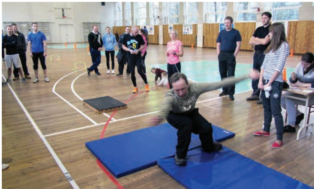
Talimängudele jagus nii osavõtjaid kui ka pealtvaatajaid.

Täiskasvanud võistlesid lisaks ringijooksule ja paigalt kaugushüppes ka topispalli-